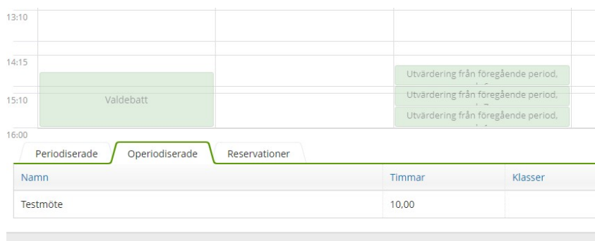
Figur 1: Övrigt arbete